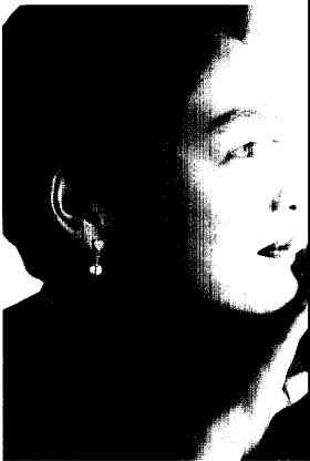
ブラックス1400円① パール・ダイヤモンドピアス25000円②

ピアスをしたために耳がしくじくしたり、かさかさになってしまったりと、とかくトラブルの話は多いもの。なぜこんなにトラブルが多いのでしょうか。どうすればそれは防げるのでしょうか。さきんごとしたピアストラブルの情報をキャッチし、トラブルをできるだけ起こさないようにしたいものです。