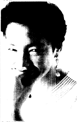
フェイスホールピアス5種別

ピアスは人間が文明をもった時から、この世の紳士淑女の目を飾ってきた、由緒ある装身具。つける場所が耳ということもあって、まつわる話も多いのです。ピアスに関する知識に影りを添えるお話はかりを集めてみました。ピアスが今よりもっと好きになるかもしれません。